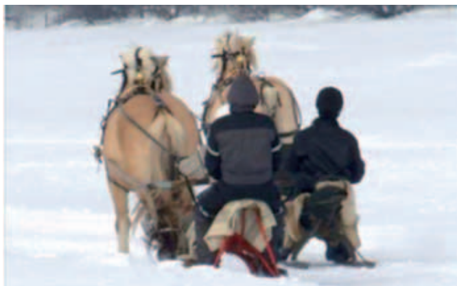
PS. Datteren vant.

Og så var det en aldri så liten familiær kamp: far mot datter!