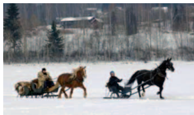
Sleder: "man tager det man haver"!