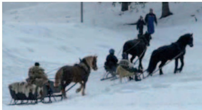
En pust før bakken etter endt løp.

Kjetil startet sin Nordlandshest Berdalsdina. Dina blandt venner, og Duracell for oss som opplevde henne på turen Østfold på langs i regi av Østfold Turhestforening. Månen til arbeidsom liten hest skal du lete lenge etter! Da det var premieutdeling fikk datteren min være med og ta imot pokalen, og det var stort!