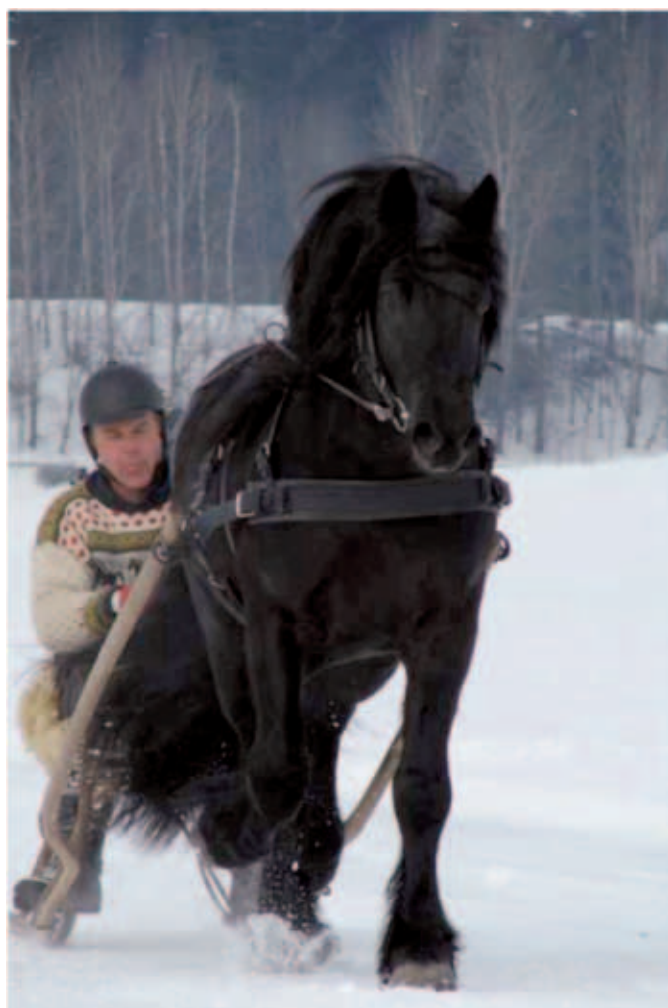
Prakteksemplar av en dølahingst.