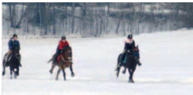
Neste klasse. Det sto ikke på iveren av de ridende heller!

Her var det virkelig lagt opp til en hyggelig dag for alle. De som ikke hadde kjørehest eller ville/kunne kjøre, ja da kunne man ri. Førstemann til mål, uansett gangart! To klasser startet, og det så virkelig ut som at de hadde det gøy.