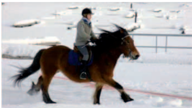
Fornøyd vinner av den ene klassen.